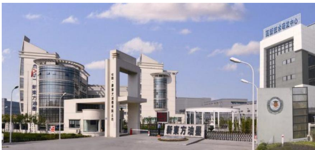
图 B.1-1 公司现代化高新园区

公司从 2016 年 5 月开始导入卓越绩效管理，建立自我评价机制，定期组织管理层开展管理成熟度评审，到优秀企业参观学习，按“领导班子统一认识；中层领导倾力推进；广大员工积极参与；各个部门全力以赴”的原则，把卓越绩效管理向全公司推广，促进企业管理再上新台阶。